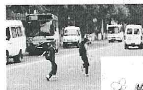
Безопасность на улице